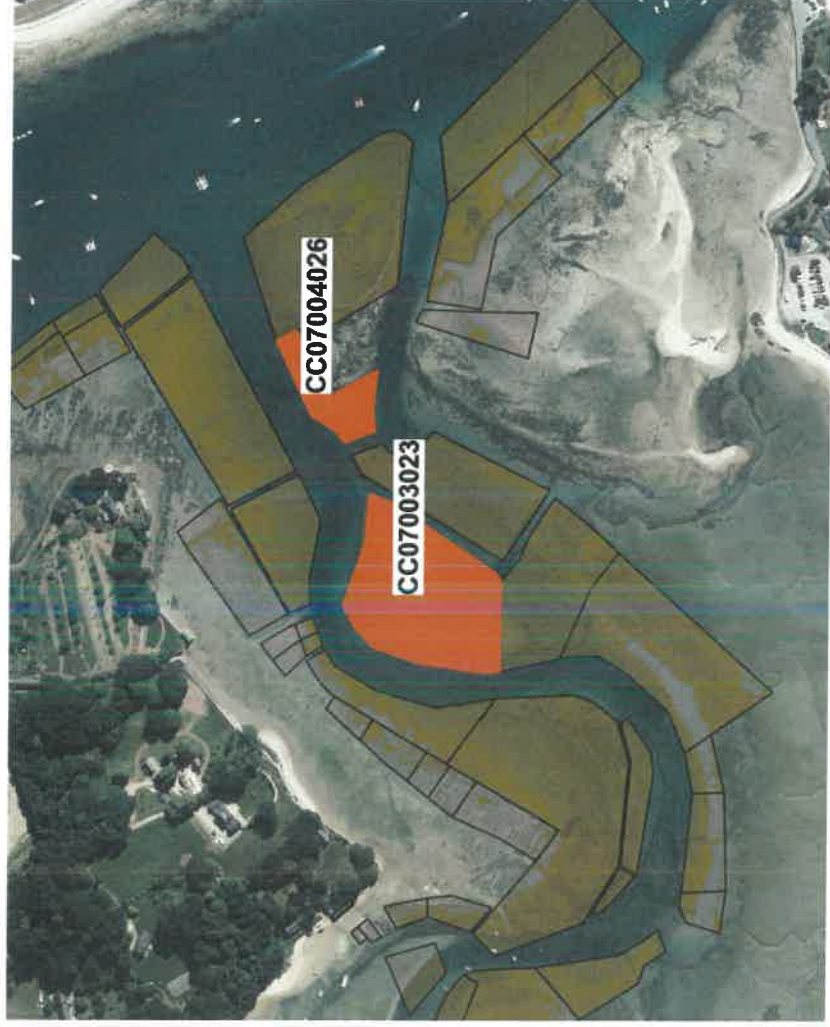
(Fond de plan Bdortho 2021)