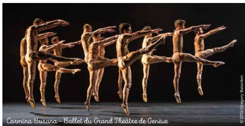
Carmina Burana - Ballet du Grand Théâtre de Genève