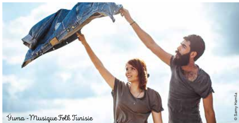
Yuma - Musique Folk Tunisie